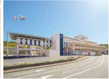
徳島県鳴門病院外観