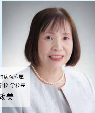
徳島県鳴門病院附属 看護専門学校 学校長