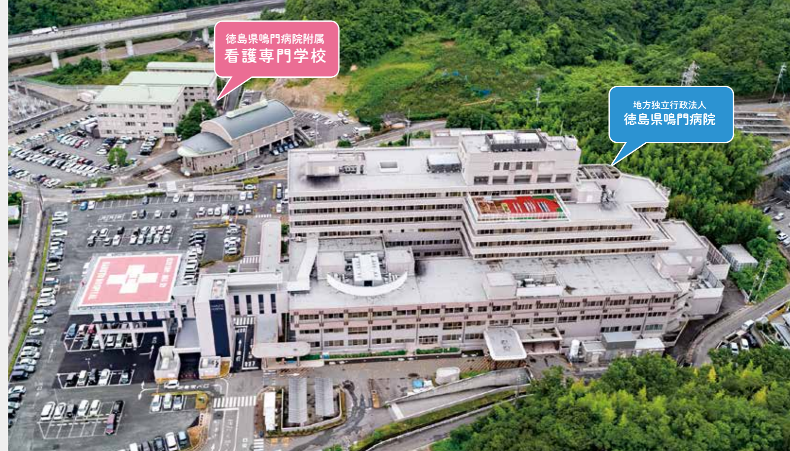
徳島県鳴門病院附属看護専門学校