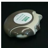
ディスクス練習器