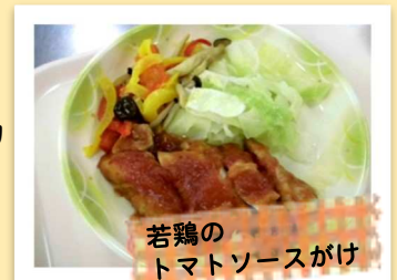
若鶏の トマトソースがけ

常食と比較し、繊維の少ない 野菜を使用した内容。 調理方法は焼き物・煮物・蒸し物 など(揚げ物は出ない)。