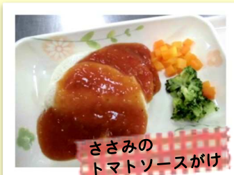
ささみの トマトソースがけ

「一口大」や「口蓋と舌でつぶ せる軟らかさ」などを考慮し、 安全性を重視。 パサつくもの・弾力のあるもの・ 魚の骨などの食材を5分菜食 から除いた内容。