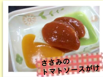
ささみの トマトソースがけ

各食材を裏ごしし、増粘剤 でゲル状にした内容でムース のような食感。 咀嚼困難な方や嚥下調整食Ⅲ からの食形態UPに適応。