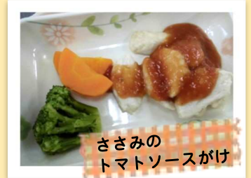
ささみの トマトソースがけ