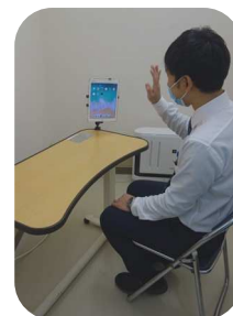
《1階正面玄関ホール内様子》 タブレット端末で通話できます