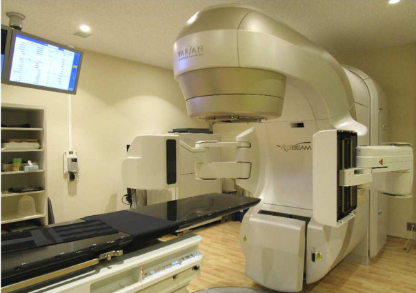
（最新リニアック：米国VARIAN製 Vital Beam）

平成31年3月設置から調整が終わり、7月下旬より放射線治療を開始しています。3種類のX線と、5種類の電子線を使い分けて全身の治療が可能となりました。これまで徳島大学病院等へ紹介していた症例の患者さんも、大半の治療が当院で行えるようになりました。照射部位がミリ単位で調整可能となり、ピンポイントでの治療が行えます。加えて治療器本体でCT撮影が可能となり、治療計画時のCT画像とマッチング（重ね合わせ）できる位置照合システムを用いて高精度の治療を行っております。また、短時間での治療が可能となったことにより、肺の症例では呼吸停止中での治療も行っています。